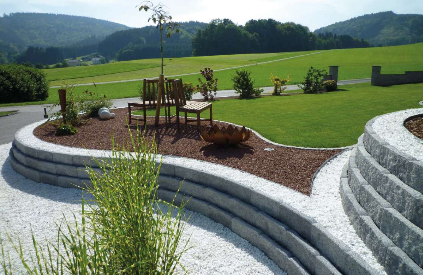
Böschungstein konisch gespalten | Farbe: Grau-Schwarz