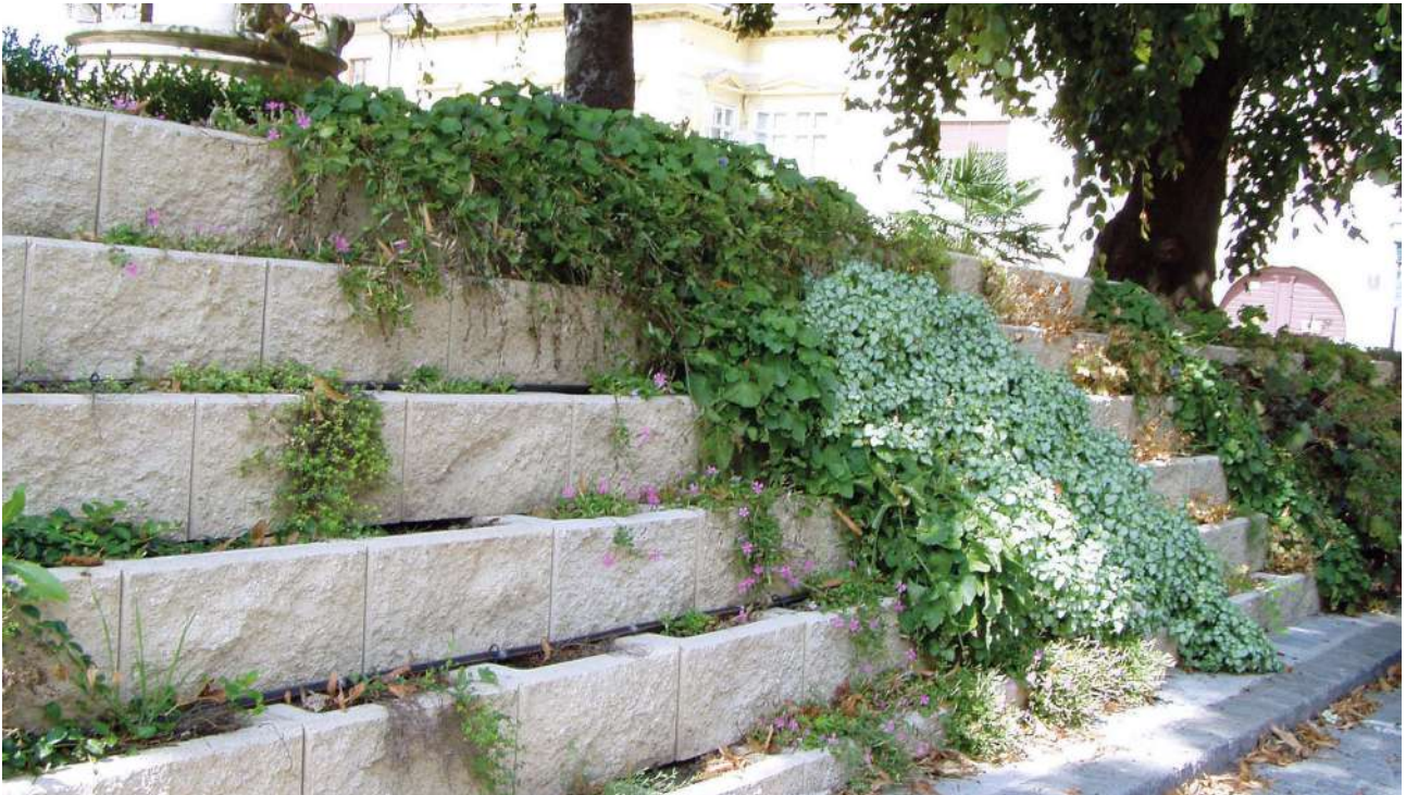
Böschungstein gespalten | Farbe: Zementgrau