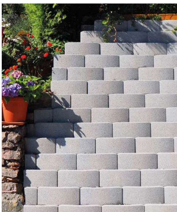
Böschungstein konisch steinglatt | Farbe: Grau

Diese Böschungsteine sind zeitlos, bringen Schwung in Ihre Gartenoase und sind darüber hinaus ein wahrer Blickfang. Dank ihrer einzigartigen Form sind Rundungen keine Grenzen gesetzt. Zudem können diese Böschungsteine gestaffelt gesetzt und ideal zum Bau von höheren Böschungen genutzt werden.